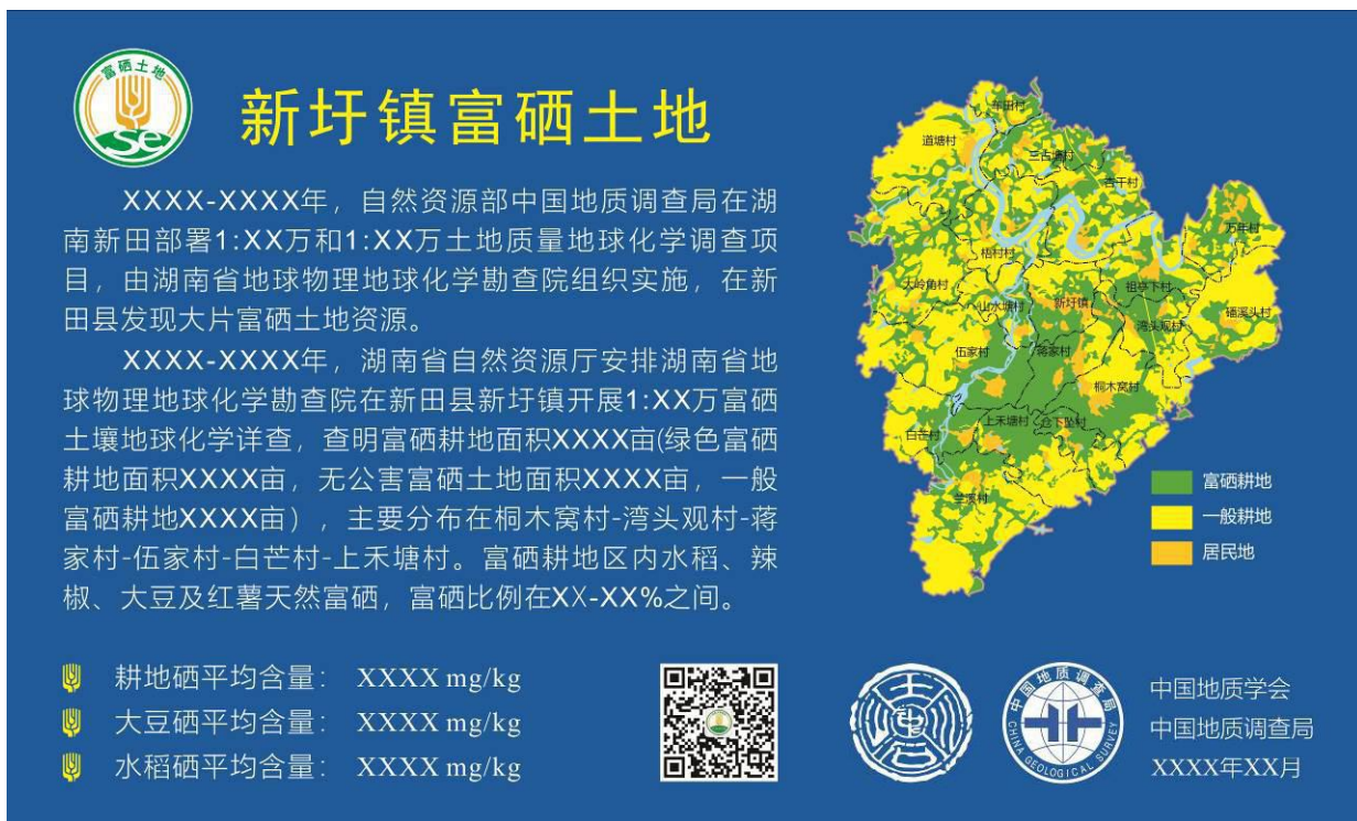
图 2 富硒土地标识牌示样